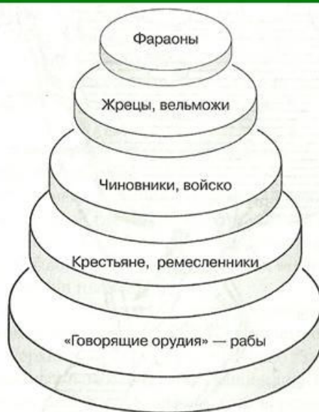
Общество в Древнем Египте