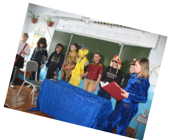
Волонтеры у младших школьников