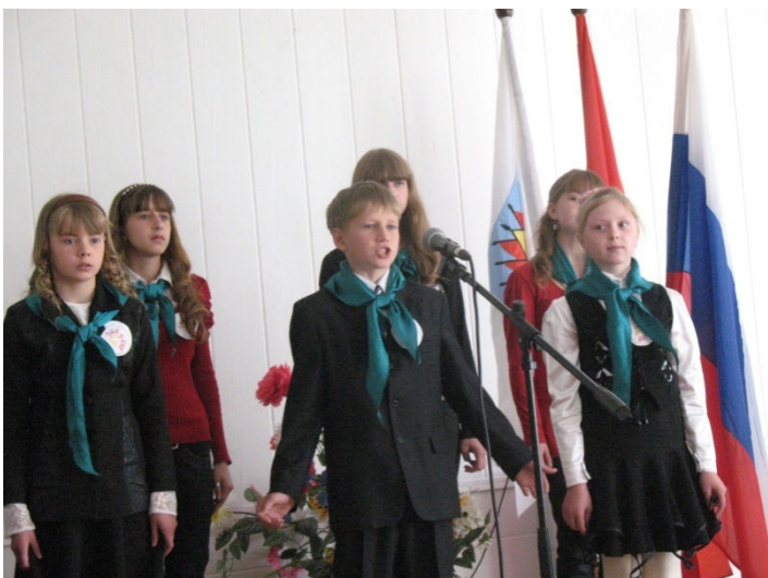
Визитка на слете патриотических клубов